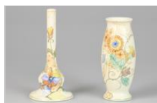
1468: Een lot van (2) plateel vaasjes met bloemdecor, één met chrysant en één met viooltje, gepolychromeerd. Plateelfabriek Zuid-Holland (PHZ). Gouda, 20e eeuw.

Afm. circa 17,5 x 8,5 cm en 15,5 en 5,5 cm. Geschatte opbrengst: € 60 - € 100.