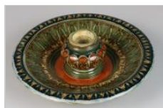
1466: Een plateel inktpot. Plateelbakkerij Rozenburg. Den Haag, 20e eeuw.