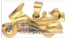
3980: Hanger bicolor goud - 18 kt. In de vorm van een motor. LxB: 2,1 x 3,8 cm. Gewicht: 5,5 gram.