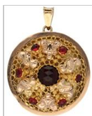
3985: Antieke hanger bicolor goud, granaat - 14 kt. LxB: 4,5 x 3,5 cm. Gewicht: 6,2 gram.