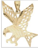
3979: Hanger geelgoud - BWG 10 kt. In de vorm van een roofvogel. LxB: 3,5 x 3,3 cm. Gewicht: 3,3 gram.