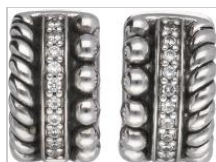
1313: Ti Sento Milano hele creool oorringen zilver, met zirkonia - 925/1000.